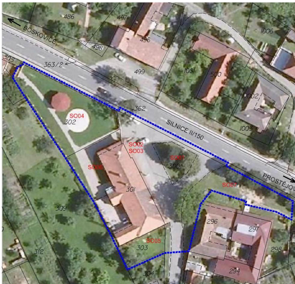
Přehled jednotlivých úprav (červená barva).