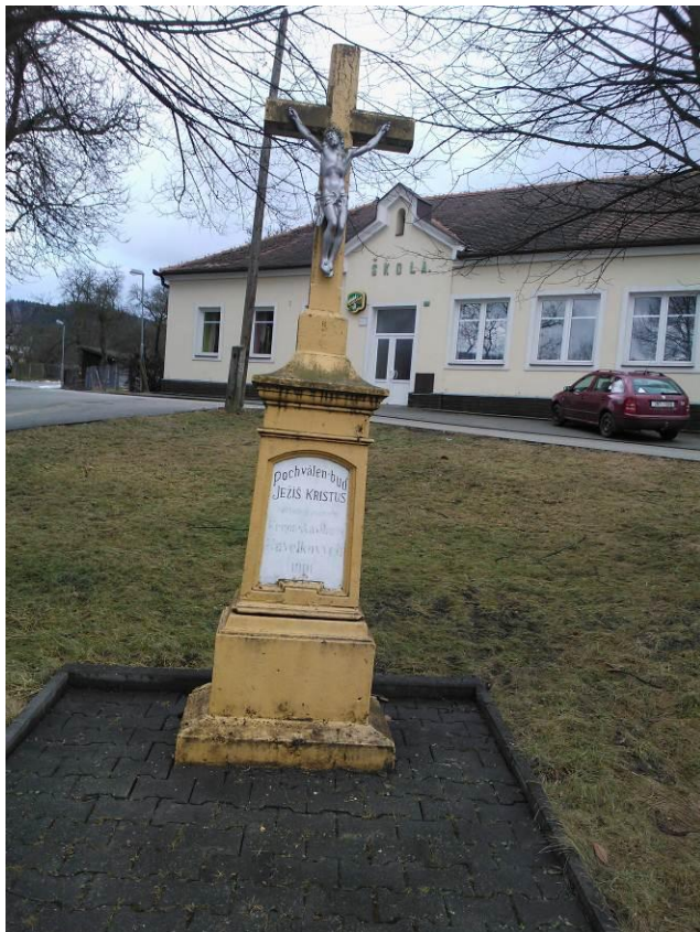
Stávající stav (pohled směrem od silnice II/150)

SO 01 Obnova kříže a navazujících ploch – stávající drobná sakrální architektura – kříž je umístěn v zeleni před bývalou školou. Kříž je natřen žlutou barvou, J.Kristus šedou barvou. Kříž je pískovcový. Kolem kříže je vytvořen prostor z betonovou dlažbou šedé barvy, která je ohraničená betonovým obrubníkem. Kříž je umístěn mezi dvěma vzrostlými stromy (lípy).