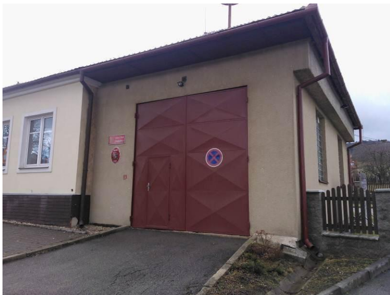
Stávající stav. (pohled z místní komunikace)

SO 02 Oprava vjezdu do hasičské zbrojnice – asfaltový vjezd do hasičské zbrojnice je vymezen betonovými obrubami. Vjezd je v několika místech propadlý, zborcený.