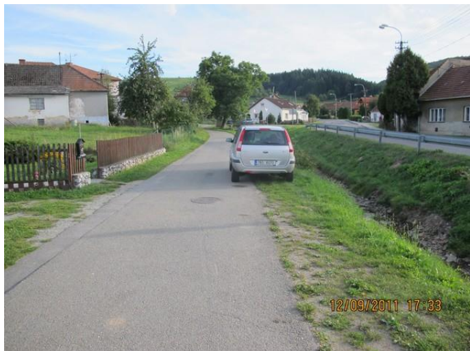
Stávající stav (pohled směrem ke kapličce)

SO 02 Úprava nábřeží Valchovky – nábřeží Valchovky je vymezeno stávající asfaltovou místní komunikací, stávající silnicí II/150 odbočkou na Velenov a RD s č.p.50. Břeh Valchovky je většinou zatravněn, místy jsou nevzhledné nezatravněné plochy. Koryto Valchovky v této části obce bylo v září tohoto roku z důvodu protipovodňových opatření pročištěno, čímž došlo ke zlepšení odtokových poměrů a ke zkapacitnění průtoku. Vodní tok Valchovka je ve správě Povodí Moravy, Závod Dyje.