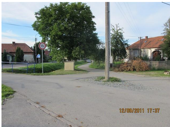
Stávající stav. (pohled od kapličky k silnici II.třídy)

SO 03 Úprava veřejného prostranství u kapličky – řešené území se nachází mezi stávající regulační stanicí plynu a betonovým sloupem el. vedení naproti RD s č.p.50. Řešená plocha je zpevněna asfaltem, štěrkem. Okolí regulační stanice je zatravněno. Za regulační stanicí se nachází vzrostlý strom.