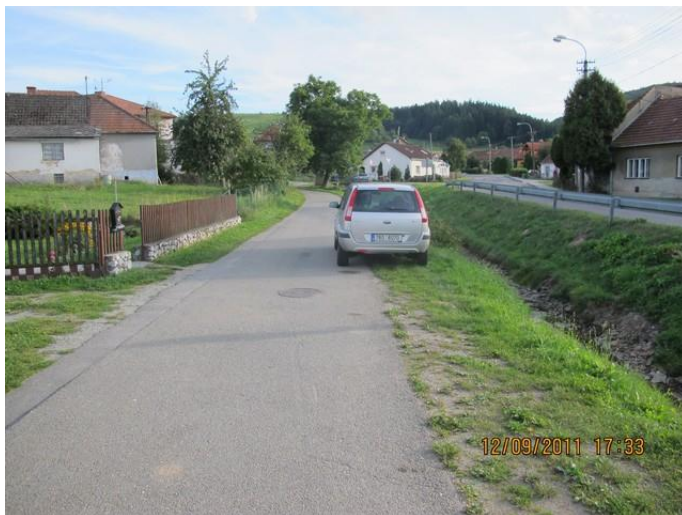
Stávající stav (pohled směrem ke kapličce)